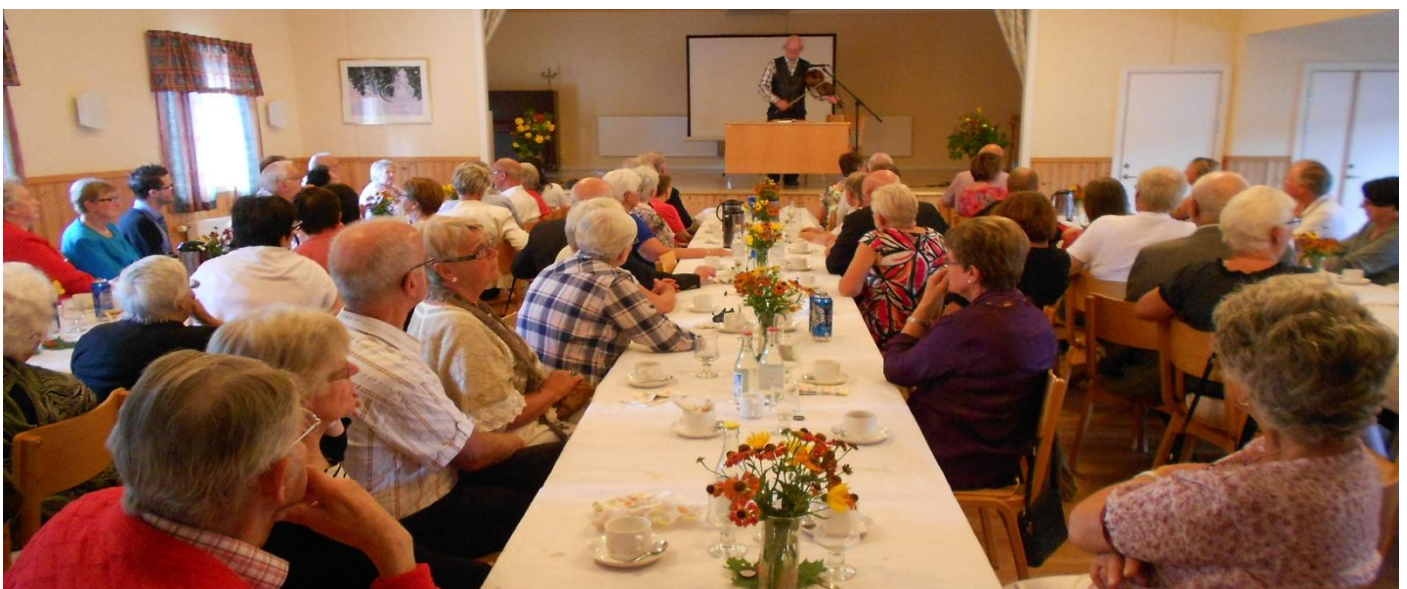
Hemvändardag och föreningens 40-årsjubileum firades den 25 augusti. Som avslutning på årets program var det som vanligt sopplunch på Tacksägelsedagen den 13 oktober.

Styrelsen tackar för det gångna verksamhetsåret.