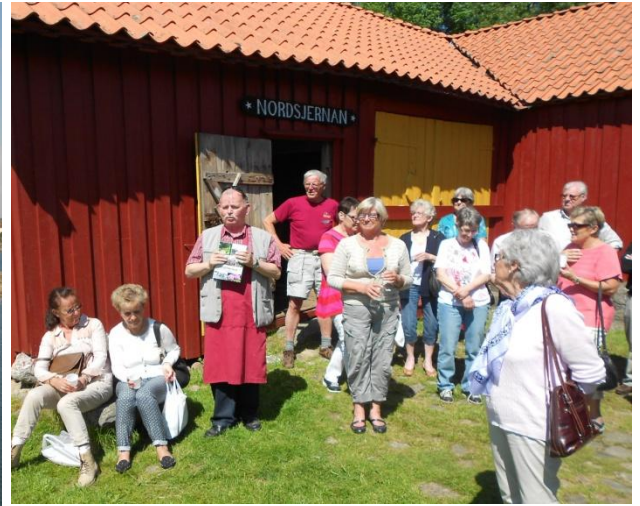
Hembygdsvöreningens resa den 30maj gick till Göteborgs norra skärgård, Öckerö, Hönö, Hälsö och Fotö.